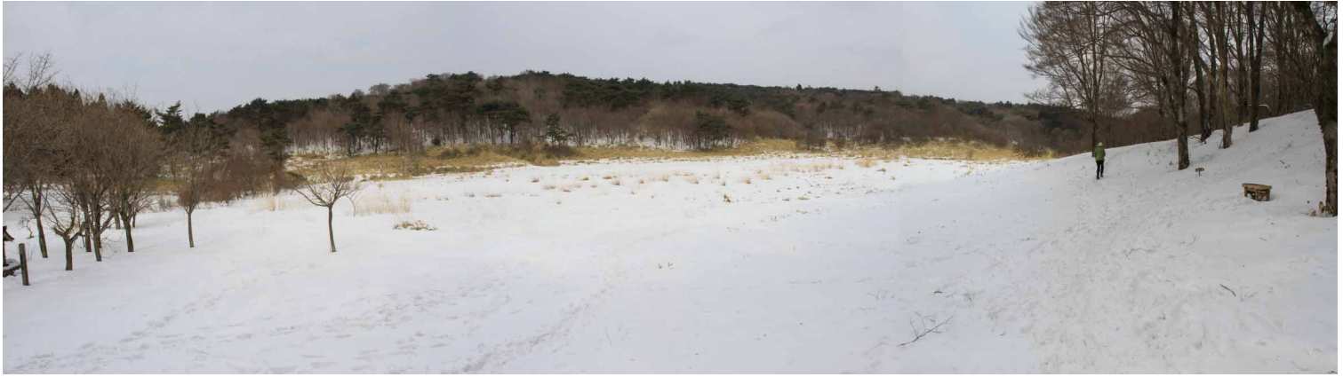
▲ 雪を被った竜神平