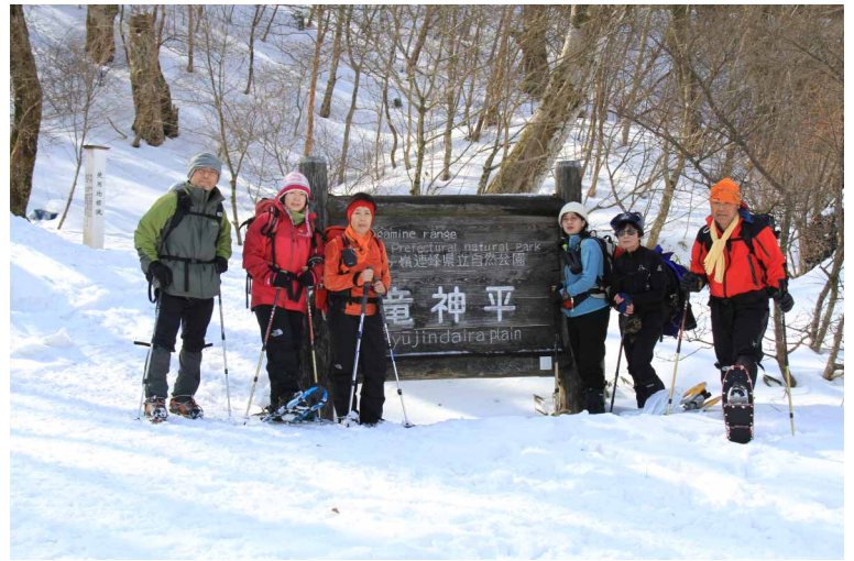
▲ 龍神平でみなさんと