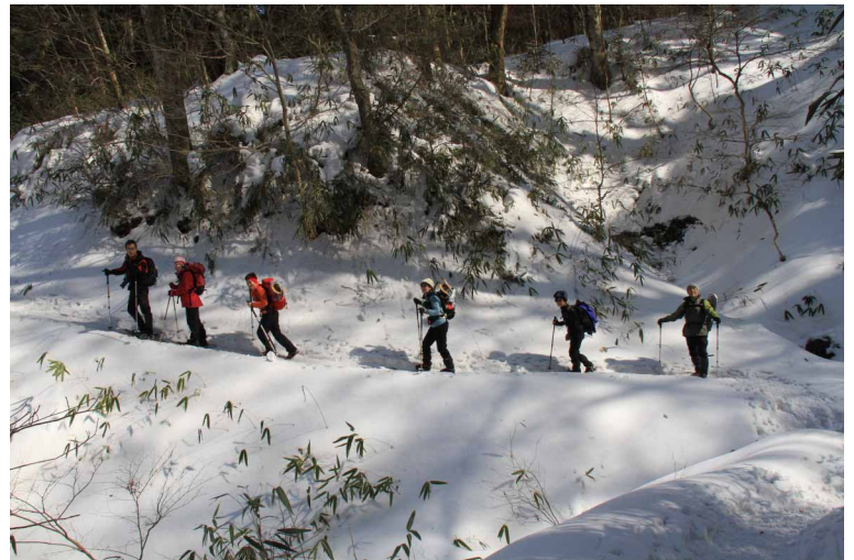
▲ スノーシューは雪道もラクチン

今年は雪が豊富なので急遽スノーハイキングに！ 手軽でオススメなのが、東温市の皿ヶ峰です 皿ヶ峰は笹ゆりなどの花が多く楽しめる山で有名ですが 雪の時期も安心して遊べます この日もポカポカ陽気の中登りはアイゼン、途中からは スノーシューに履き替えフアフアの雪歩きを楽しむ事 が出来ました